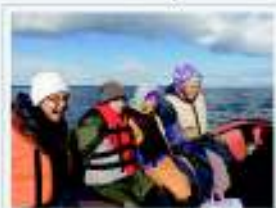
По Бельскому озеру, 2018