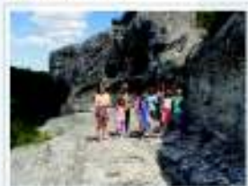
Пляжи в Золотоморье, Киев, 2013