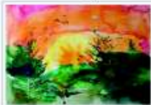
Кирил Журавский, 3 лет. "Зима"