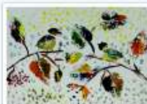
Юрия Кузнецова, 3 лет. "Осенние листья"