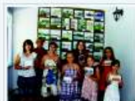
Выставка фотографий детей в Доме культуры №4, Восточный остров, 2014