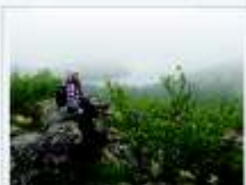
На Ивановском озере, 2019