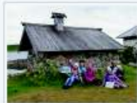
На Зеленом острове, 2019