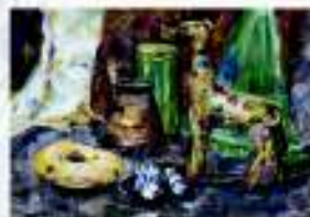
Дарья Боча, 13 лет, "Уютный вечерок"