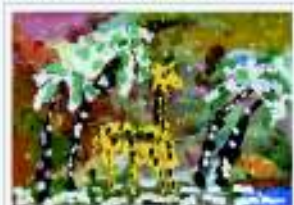
Дарья Кабанова, 7 лет. "Улицы в солнечный день"